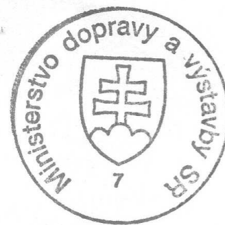
PaedDr. Arpád Érsek minister dopravy a výstavby SR