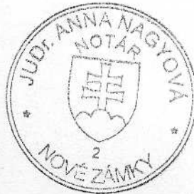
Tímea Fitosová zamestnanec poverený notárom

Upozornenie! Notár legalizáciou neosvedčuje pravdivosť skutočností uvádzaných v listine (§58 ods. 4 Notárskeho poriadku)