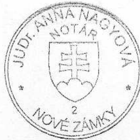
Tímea Fitosová zamestnanec poverený notárom